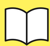
график выдачи дз

В зависимости от тарифа предусмотрены дополнительные задания с индивидуальной проверкой