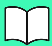
график выдачи дз

В зависимости от тарифа предусмотрены дополнительные задания с индивидуальной проверкой