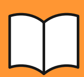
график выдачи дз

В зависимости от тарифа предусмотрены дополнительные задания с индивидуальной проверкой